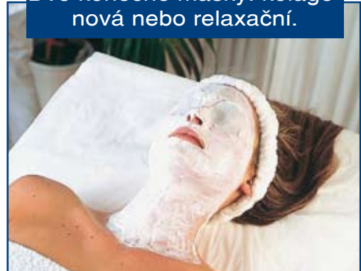
Dvě konečné masky: kolagenová nebo relaxační.

G Poté masku opláchněte, aplikujte specifické tonikum a zbývající 1/3 ampulky Lifting & Firming Fluid a naneste tenkou vrstvu Lifting & Firming Cream .